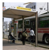
⑨ 北方・北九大バス停