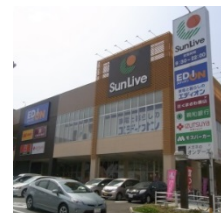
⑩ サンリブもりつね