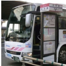
① 福岡行高速バス停