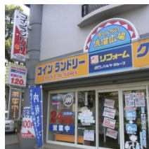
⑧ コインランドリー