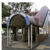
② モノレール北方駅