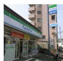
⑤ ファミリーマート