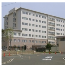
③ 小倉医療センター